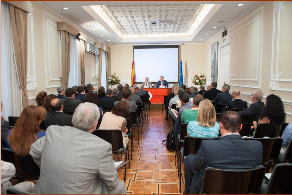
Asistentes al I Seminario Hispano-Portugués celebrado en Madrid en la Sede del Consejo General de Economistas de España