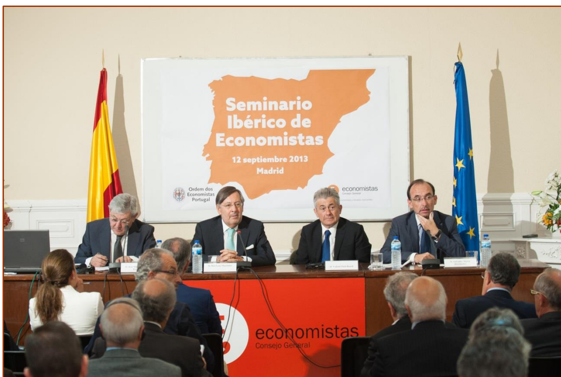
Coloquio entre Presidentes, ponentes y público asistente durante el I Seminario Hispano-Portugués