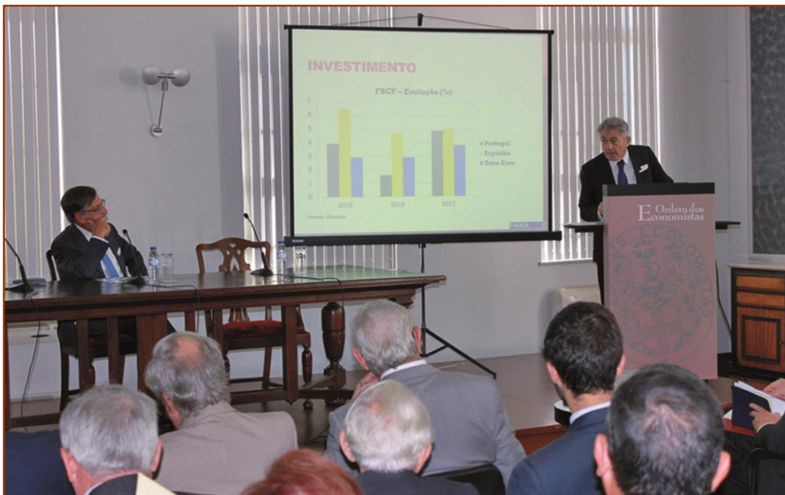
Los presidentes de las organizaciones profesionales de Economistas de Portugal y España durante una de las sesiones del IV Seminario