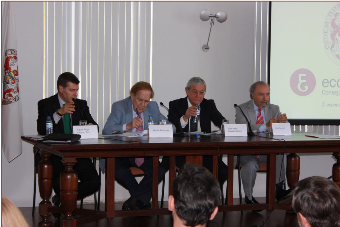
Sesión del II Seminario con ponentes portugueses y españoles