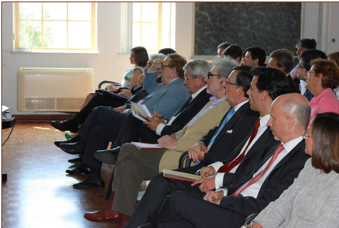
Asistentes al II Seminario celebrado en Lisboa, durante una de las sesiones del mismo