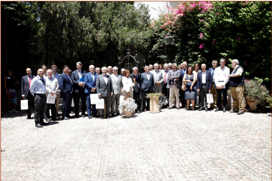
Ponentes, e invitados durante una visita guiada al Palacio de Viana en el VI Seminario Ibérico de Economistas