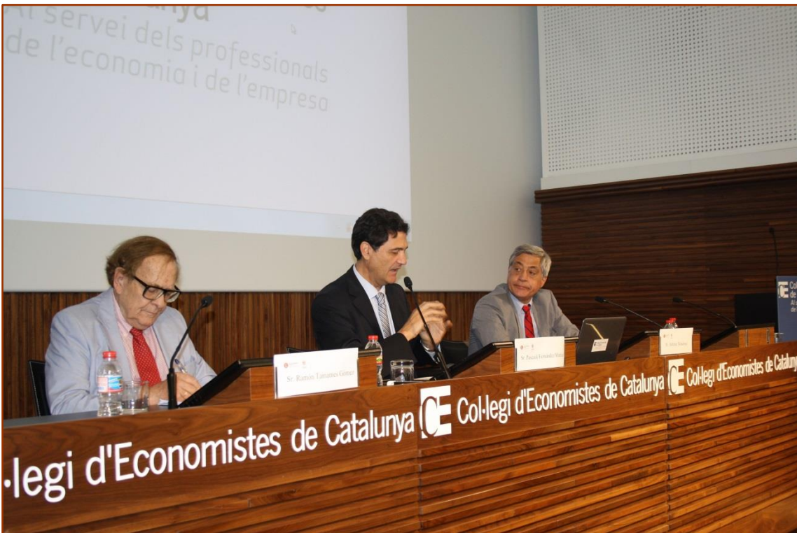
El Decano-Presidente del Colegio de Economistas de Madrid presidiendo una de las sesiones del III Seminario