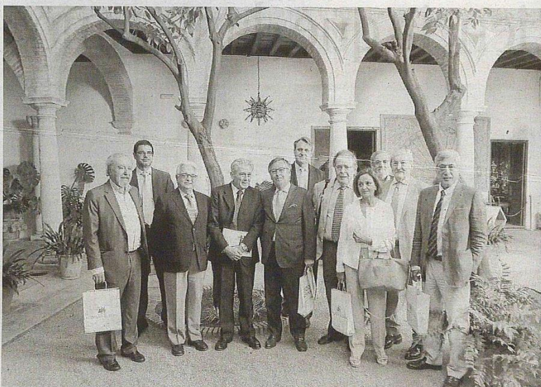
Participantes en el quinto Seminario Ibérico de Economistas.

Los economistas de España y Portugal defendieron además el