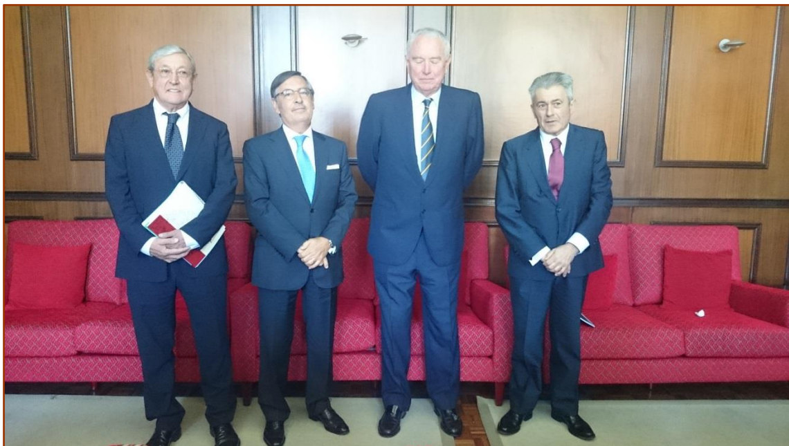
El Embajador de España en Portugal, los Presidentes de ambas organizaciones de Economistas y el Director del Seminario