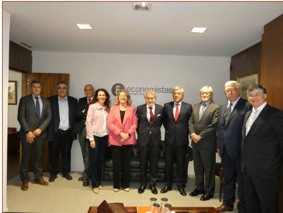
Todos los intervinientes en el IV Seminario