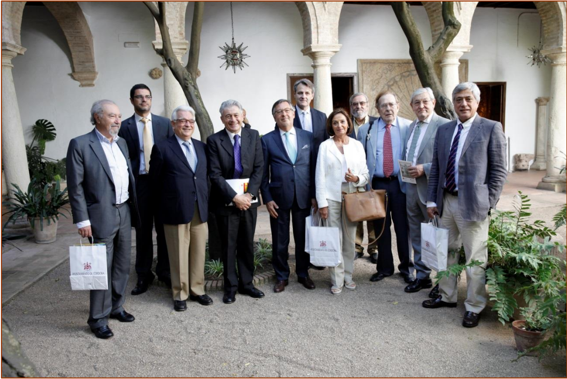
Ponentes e invitados al VI Seminario Ibérico de Economistas