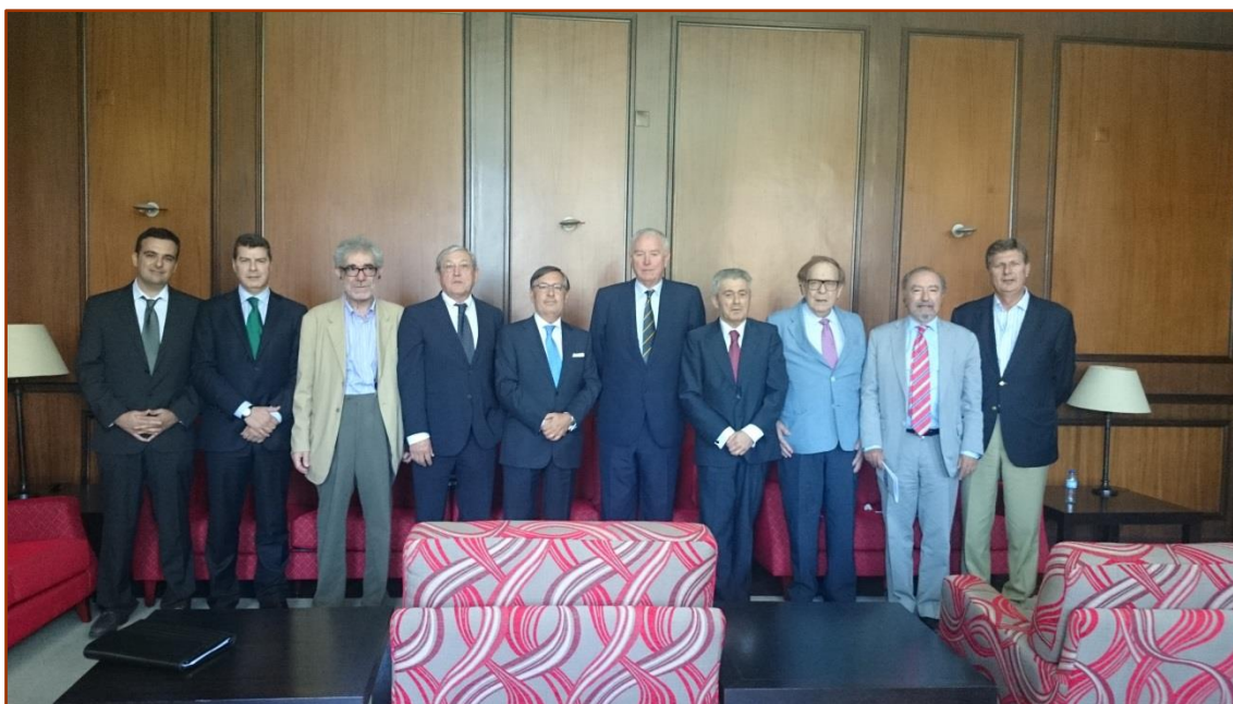
El Embajador de España en Portugal, los Presidentes del Consejo General y de la Ordem dos Economistas y ponentes del II Seminario en Lisboa