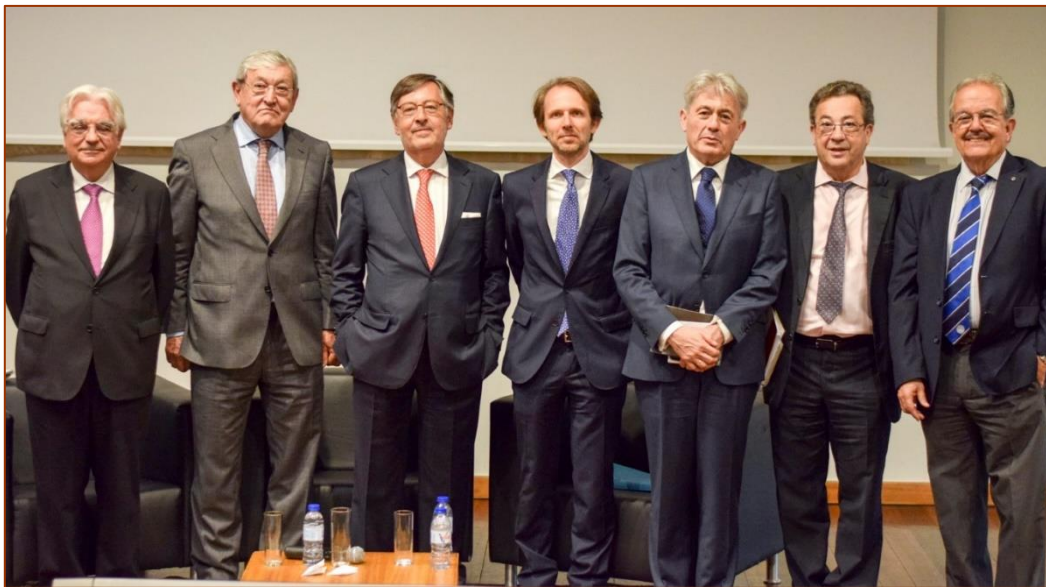
Ponentes que han participado en el VI Seminario Ibérico de Economistas