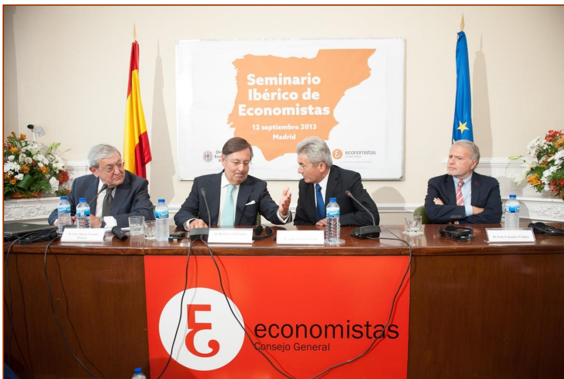
Apertura del I Seminario Hispano-Portugués en Madrid con la intervención de ambos Presidentes